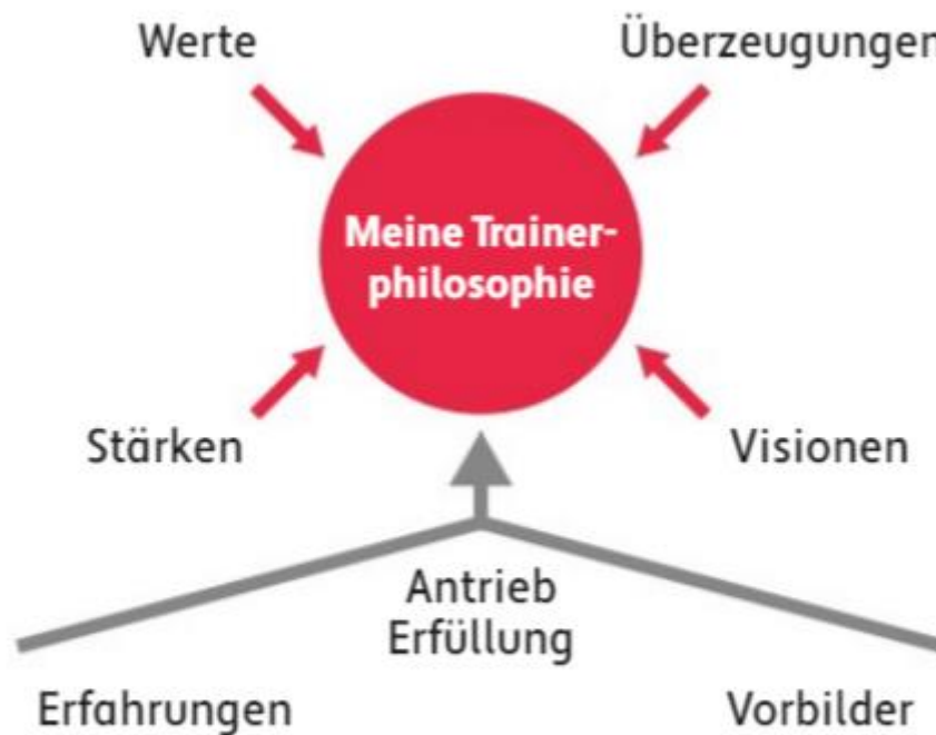
Abbildung 2: Faktoren einer Trainerphilosophie

Abb. 2: Faktoren einer Trainerphilosophie (Linz/ Finck, in: Leistungssport, 4/2022, S. 33)