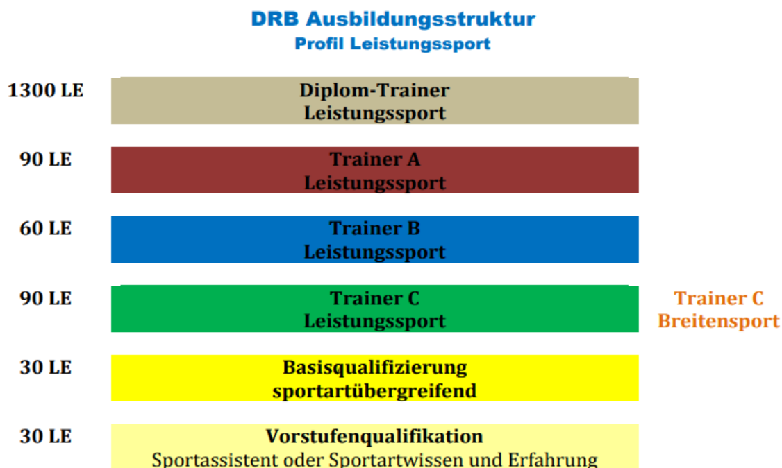
Abb. 1: Die Ausbildungsstruktur des Deutschen Ringer-Bundes im Leistungssport. In: Ausbildungskonzeption (2017) , S. 15.

In den folgenden Kapiteln werden lediglich die Ausbildungsstufen beschrieben, welche im Land Brandenburg zum Erwerb einer ringkampfspezifischen Lizenz notwendig und durch den RVB sowie der regionalen Bildungspartner (Basisqualifikation/ Übungsleiter C- Lizenz Breitensport) organisiert werden.